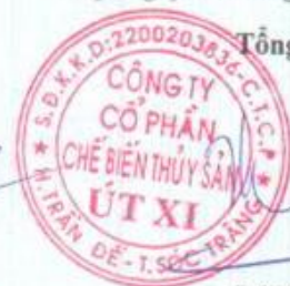
Lý Bích Quyên